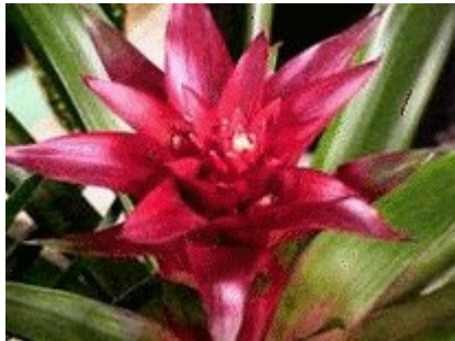
hoa móng rồng - bromeliads

“Xin lỗi, nhưng em sẽ không thực hiện được mong muốn ấy. Em bị kẹt với anh, em yêu, bởi vì đứa bé trong bụng em là của anh.”